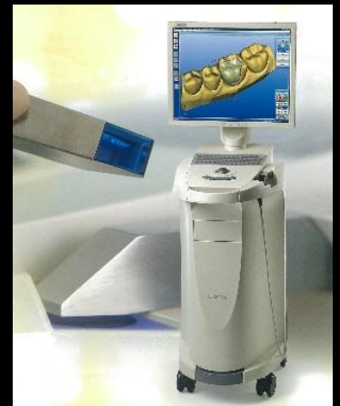
管理医療機器 特定保守管理医療機器 販売名: セレックAC 医療機器承認番号: 22200BZ100012000