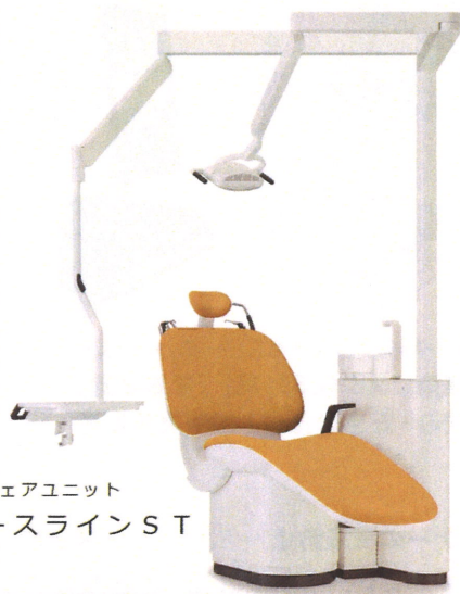
チェアユニット スペースラインST

会場 株式会社アスカデンタルサプライ 〒630-8442 奈良県奈良市北永井町372番地 奈良事務機別館3階 TEL 0742-61-6480