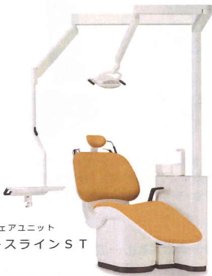
チェアユニット スペースラインST

会場 株式会社アスカデンタルサプライ 〒630-8442 奈良県奈良市北永井町372番地 奈良事務機別館3階 TEL 0742-61-6480