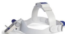
EyeMag Pro S ヘッドバンド