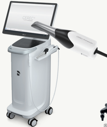
口腔内スキャナ CEREC プライムスキャン