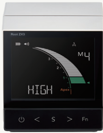
歯科用根管長測定器 (一般電気手術器) ルート ZX3