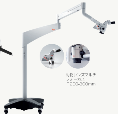
対物レンズマルチフォーカス F200-300mm 歯科用マイクロスコープ ライカM320-D FULL HD カメラ内蔵