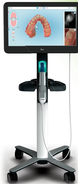
デジタル印象採得装置 歯科技工室設置型 コンピュータ支援設計・ 製造ユニット 歯科診断用口腔内カメラ iTero エlement 5D Plus

販売名 セレック プライムスキャン AC 医療機器の分類 管理医療機器(クラスII)/特定保守管理医療機器 医療機器承認番号 301005ZX0044000 一般的名称 チェアサイド型歯科用コンピュータ支援・製造ユニット 製造販売 デンツプライシロナ株式会社 東京都港区麻布台1-8-10 販売名 THIOS 5 オーラルスキャナシステム 一般的名称 管理医療機器 デジタル印象採得装置(チェアサイド型歯科用コンピュータ支援設計・製造ユニット)(歯科技工室設置型コンピュータ支援設計・製造ユニット)(光学式口腔内カメラ) 医療機器承認番号 305005ZJ00031000 医療機器の分類 管理医療機器(クラスII) 選任製造販売 3Shape Japan 合同会社 〒107-0052 東京都港区西麻布二丁目11-2 SHINKOH 西麻布ビル