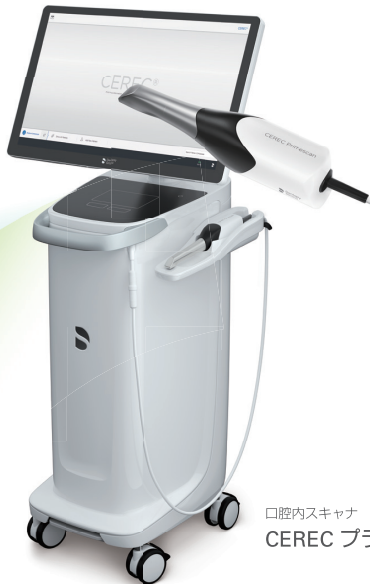
口腔内スキャナ CEREC プライムスキャン