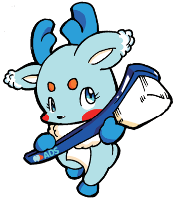
アスカデンタルサプライ 新キャラクター“アスカル”